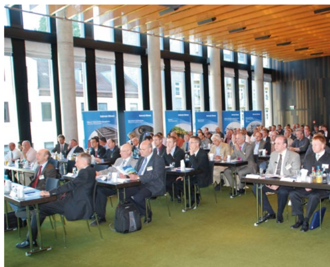
Die Foren bieten mit einer Kombination aus Fachvorträgen und Exkursionen breiten Raum für Diskussionen und Erfahrungsaustausch zwischen Verkehrsunternehmen, Bahnindustrie und Aufsichtsbehörden.

Unter dem Motto „Verbesserungspotentiale der Wettbewerbsfähigkeit“ referieren Experten aus Wissenschaft und Praxis über neueste Entwicklungen aus den Bereichen Technik, Instandhaltung, Finanzierung und Rahmenbedingungen. Neben der Möglichkeit, frühzeitig Trends und Entwicklungen erkennen zu können, bieten die Foren eine ausgezeichnete Plattform für den Erfahrungsaustausch unter Fachkollegen.